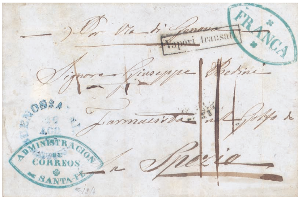
Letter from Santa Fe (Argentine) headed April 12, 1857(!) to Spezia (Liguria, Italy), transited to Buenos Ayres and taken on board the SS. Italia sailing August 16 to Rio de Janeiro. Here the letter was embarked on board the SS. Torino departing on September 1st. Backstamped "Genova October 8" in transit and arrival c.d.s. on October 10. The only recorded letter known coming from a different port of Argentine, probably the rarest.

Posta in vendita il 12 maggio 1859 al prezzo base di Lire 125.000, fu riacquistata dal Rubattino. Il 17 marzo 1861 entrò a far parte della Marina Mercantile Italiana. Nel 1881 venne trasferita alla Navigazione Generale Italiana-Flotte Riunite Florio-Rubattino. Fu demolita nel 1892.