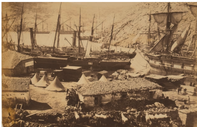
Above: Cossak Bay, Balaclava. (Library of Congress, LC-USZC4-9205, photo by Roger Fenton)

Una particolare convenzione tra la Gran Bretagna e la Francia era stata sottoscritta per i trasporti delle valigie postali inglesi con l'utilizzo delle navi francesi che effettuavano servizio tra Costantinopoli e Marsiglia. Una volta giunte a Londra, le lettere qui dirette, non timbrate in partenza, erano annullate dagli uffici postali dei quartieri della capitale con i timbri tipo "London City diamond" con il numero del corrispondente ufficio postale.