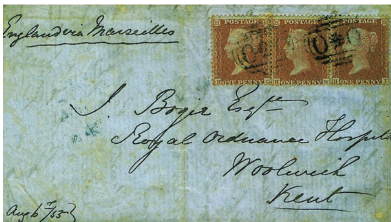
Cover to Woolwich franked with three 1854 1d, cancelled by "Star between Cyphres" postmark, applied at the Army Post Office at Constantinople. On reverse the "Post Office British Army/C" handstamp in blue.

During the Crimean War, by agreement with British allied the French, soldier's and Seaman's letters were despatched by French Mediterranean Packet via Marseille. For this service 2d was added to the basic 1d. making a total of 3d. Same rate was applied also to the Baltic and White Sea correspondence's via Dantzic. The use of adhesive stamps by soldiers and seamen was not compulsory, since supplies of G.B. stamps held by pursers and units overseas were not limitless and replenishments over long distances often took a long time.