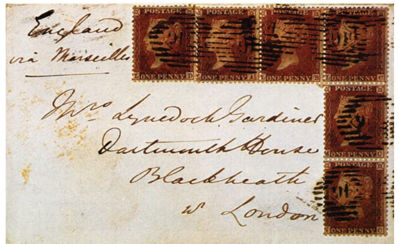
Double rate cover from Crimea franked with six 1d 1854 issue, cancelled on arrival by London City diamond "46" (Stepney Palmer's Grn). The letter was addressed to General Sir Henry Lymedoch Gardiner at Blackheath. The double rate covers are very rare. When sealed bags of Seamen's or Soldier's letters were made up and despatched directly from ships or units, the adhesive stamps remained uncanceled until the bags were opened for sorting either at a major port of entry in the United Kingdom (mainly Liverpool or Southampton) or at the section of the London G.P.O. which dealt with those mails.