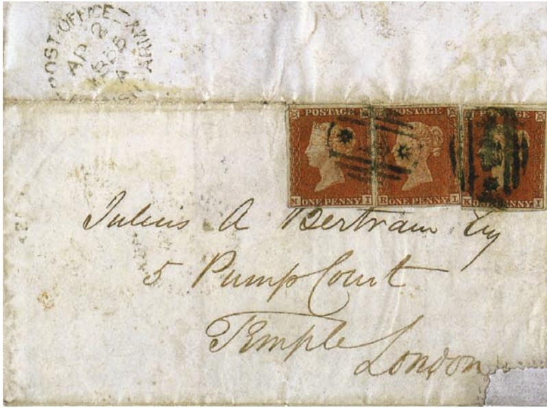
Cover to London franked with three 1841 1d imperforates, cancelled by rare "Crown between Stars" postmark, with black "British Army Post Office" cds on reverse. The "Crown & Stars" postmarks were used at the Army headquarters post office.