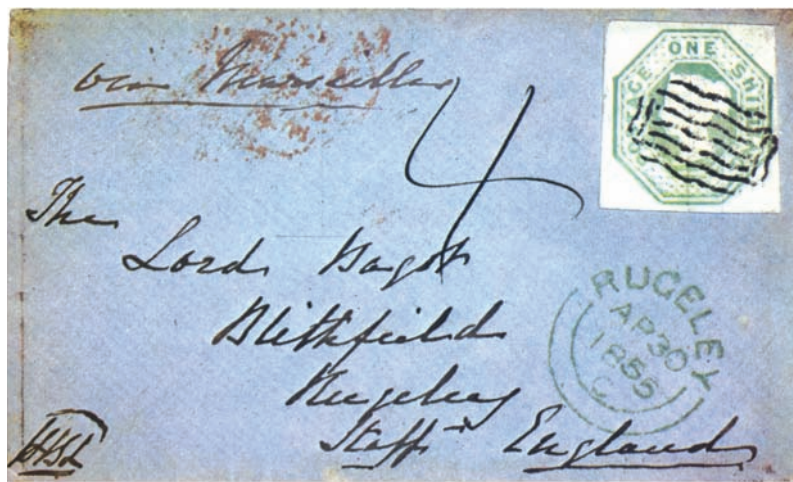
Envelope from Crimea to Rugeley, franked with 1847 1s. cancelled wavy-line with Malta cds on reverse, both applied in transit. This canceller was used prior to the availability of G.B. stamps in Malta (issued on December 1st, 1860) to prepay postage. This cancellation was required in order to cancel stamps on letters posted on their way to or from Crimea. The dates of use have been recorded as from April 1855 until September 3, 1856. On arrival the letter was charged 4d. for letters via Marseille or Malta, which rate was 1s. 4d. (Malta, The Postal History & Postage Stamps, published by Robson Lowe Ltd, for the Malta Study Circle, 1980)

L'ufficio principale del corpo di spedizione inglese fu aperto a Costantinopoli e nel Quartier Generale della British Army furono utilizzati due timbri speciali per timbrare i francobolli sulle lettere provenienti dai reparti: uno con la corona tra due stelle contornato da sbarre, ed un'altro con una stella tra due cifre "0", entrambi accompagnati da timbri della "British Army/Post Office" apposti al verso delle lettere dirette in Patria. Questi timbri, di cui si conoscono due tipi diversi, erano in colore nero, blu o rosso, secondo gli uffici, tipo a cerchio senza cornice, uno di mm. 2,8 di diametro con l'indicazione del mese, giorno e anno, e un secondo di mm. 2,5 con lettere in basso (A o B).