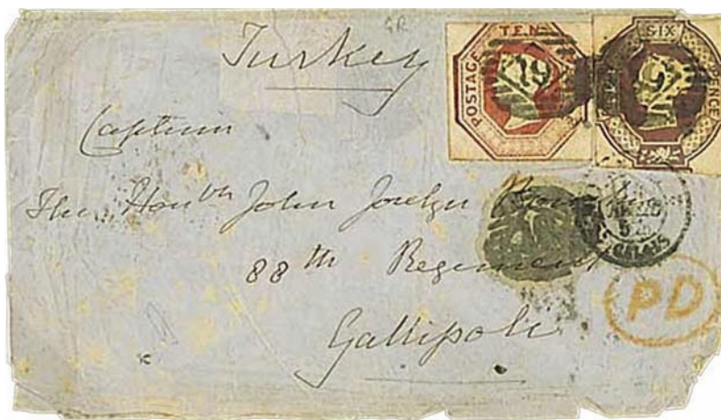
Envelope from London addressed to a Captain of the 88th Regiment at Gallipoli, franked with 10d and 6d, tied by London City diamond "19" (Halfway St Finsbury Pk.) with oval framed "PD" in red below. In accordance with the instruction of the General Post Office of April 1854, the rate for "letters to Turkey or the Black Sea, passing through France in the closed Mails dispatched from London to Malta...will be liable, in addition to this rate of Eleven Pence, to a French transit rate of Five Pence for each quarter of an ounce". The 6d is cancelled also by the French "Calais" transit cds on April 1854. (Cavendish, sale n.689, November 2006, lot 104.)