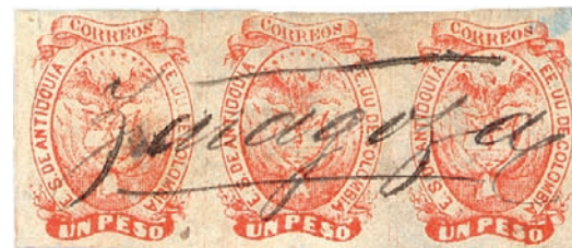
Above: Antioquia , 1868, 1 p. vermilion red, horizontal strip of three, showing complete manuscript cancel "Zaragoza". Illustrated on page 30 of Dr. Gene Scott's Colombian States handbook. The largest and only known multiple of this value.

Il primo Stato che introdusse propri francobolli per il pagamento delle tasse postali relative alla corrispondenza circolante all'interno del proprio territorio, nel 1863, fu Bolivar. Gli esemplari, di dimensioni ridottissime, riportavano le diciture "Es. Us. de Colombia/Correos del Estado" e, in basso, "Estado Bolivar". I pezzi erano due, con i facciali di 10 centesimi e di un peso. Il primo pezzo inizialmente era di colore verde e, nel 1866, uscì in colore rosso. Particolarmente raro è il 10 centesimi verde sia nuovo che usato. Va però segnalato un fatto abba-