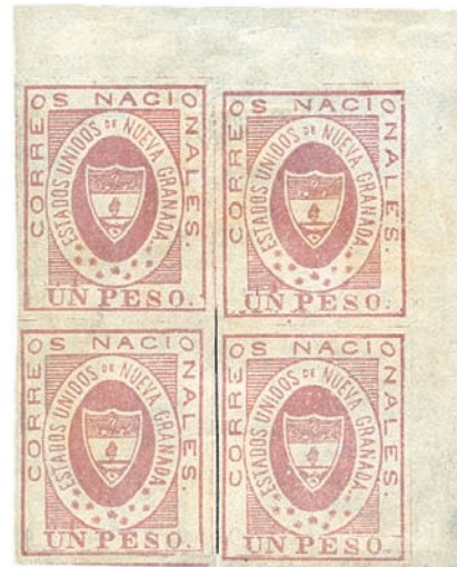
Nueva Granada , 1 peso in blocco di quattro angoli di foglio superiore destro.

Visita il sito/Visit our web site www.thepostalgazette.com