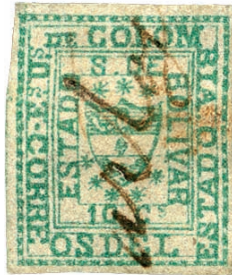
Bolivar , 10 c. green, five stars below shield, type 12, cancelled in manuscript "Cartago". One of five copies of this variety in existence.

Altra emissione stranissima è quella del 1882/83 approvata dal prefetto di Atrato. Qui, non solo non compare alcuna figura, ma neanche una dicitura. Si tratta solo di un monogramma avente, ai vertici del rettangolo, ripetuta quattro volte, la cifra 5.