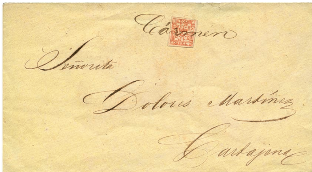
Below: Bolivar , 1863-66, 10 c. red, type 8, on envelope from Carmen to Cartagena, tied by manuscript "Carmen". Covers with 10 c. red not bisected are much scarcer than those of the 10 c. green value. Only two recorded bearing this.

Comunque, anche dopo la riforma che introdusse i Dipartimenti al posto degli antichi Stati le emissioni locali continuarono fino al 1904. Anno in cui il governo centrale impose il proprio monopolio sulle emissioni dei francobolli. Da osservare che tutti i francobolli degli Stati sono noti quasi esclusivamente oblitterati con annulli a penna.