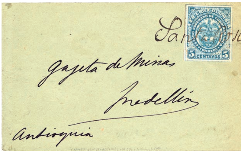
Cundinamarca , 1886, 5 c. blue, on wrapper from Santa Rosa to Medellín, tied by "Santa Rosa" manuscript cancel, with purple "Medellin" oval handstamp on reverse. A very scarce inter-departmental use. The earliest usage known on cover in Cundinamarca, as well as the only recorded cover of Cundinamarca used in the XIXth Century, being one of four known covers of this State.

Le illustrazioni di questi esemplari sono stati concessi dalla Investphila e fanno parte della prossima vendita di rarità di Colombia e Stati dell'America del Sud in programma il prossimo 20-22 marzo 2009.