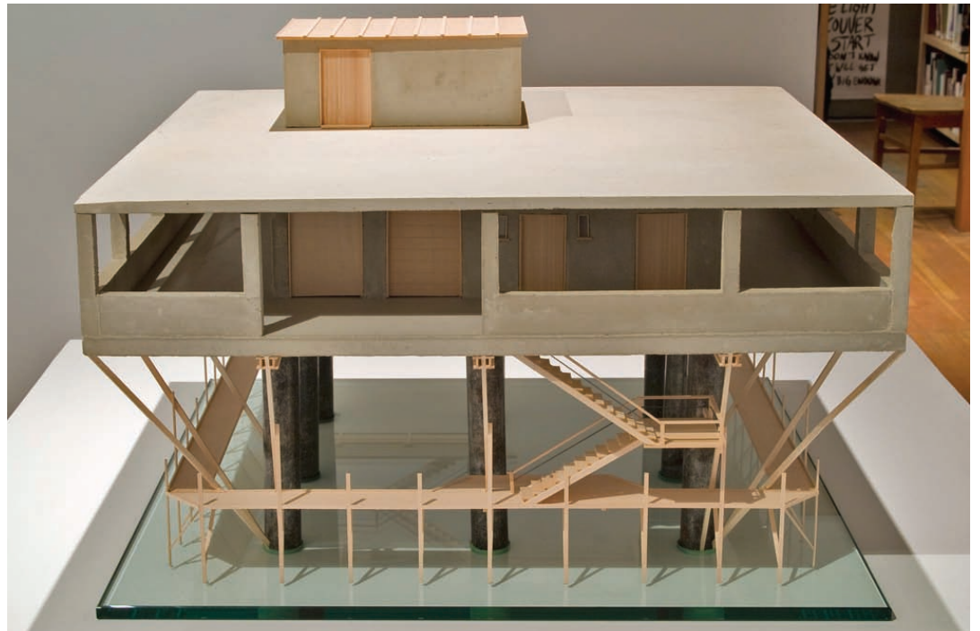
Sopra: il modellino della piattaforma. Sull'isola delle Rose il servizio idrico era garantito da un pozzo che si spingeva a 270 metri e aveva una portata di 1000 litri di acqua dolce al minuto.