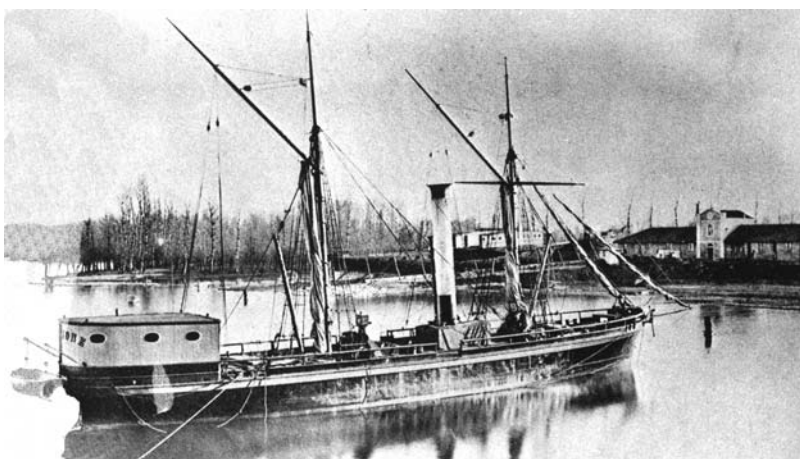
In alto: il piroscavo San Gottardo (1855-1918)