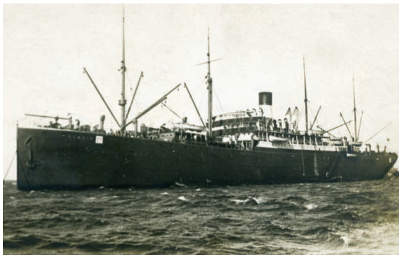
Il vapore Sannio fu costruito nei cantieri Palmers & Co. di Newcastle, ex vapore British Prince, stazzava 9200 ton. ed era lungo 143,25 m. Prima di partecipare alla guerra italo-turca come nave trasporto, effettuava servizio passeggeri per la N.G.I. sulle rotte del Nord (New Orleans) e Sud America.

Lloyd Italiano Mendoza, Taormina, Cordova.