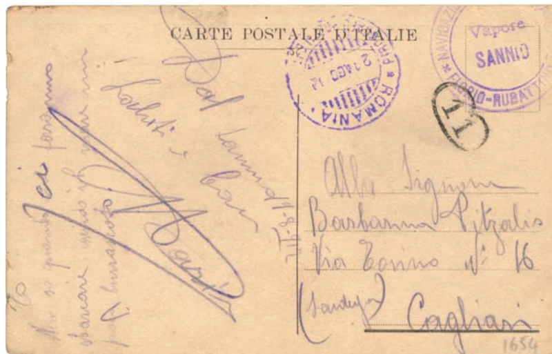
Cartolina "Dal Sannio" del 19 agosto 1912 per Cagliari, affidata per l'inoltro al piroscafo Romania che lo timbrò in data 21 agosto. Il Sannio effettuò 14 viaggi per il trasporto uomini e mezzi e nel maggio 1912 partecipò allo sbarco di Calitea (Rodi). Il Sannio affondò per collisione con il piroscafo norvegese Otto Sverdrupp il 4 luglio 1918.