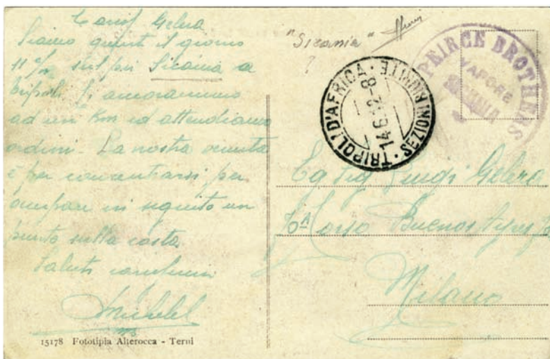
Cartolina illustrata da Tripoli, scritta a bordo del piroscafo Sicania. Il mittente, un militare delle truppe da sbarco che occuparono Misurata l'alba del 16 giugno, scrive: "...Siamo giunti il giorno 11 sul pir.fo Sicania a Tripoli. Lì ancorammo ad un km. ed attendiamo ordini. La nostra venuta è per concentrarsi ed occupare in seguito un punto sulla costa..." La cartolina presenta un timbro violetto grande del "Vapore Sicania/Peirce Brothers" e il timbro postale a data "14.6.1912-Tripoli d'Africa/Sezioni Riunite". Il Sicania partecipò all'azione di sbarco di Misurata insieme ai piroscafi civili Re Umberto, Valparaiso, Bulgaria, Washington, Verona, Europa, Sannio e Toscana. (Vedi pag. 34)