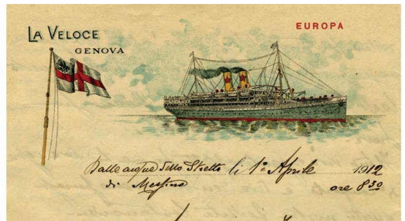
Lettera contenuta in una busta affrancata con 15c. "Michetti", annullato col bollo ovale senza data "R.Poste/Comando/della Divisione" per Napoli, giunta il 20 aprile 1912, scritta da bordo del piroscafo Europa della Compagnia "La Veloce" il 1° aprile. Nel testo, in quattro pagine, si legge: "Dalle Acque dello Stretto di Messina...ti scrivo mentre l'Europa attraversa lo Stretto di Messina le cui vestigia ancora si vedono da bordo e ci rammentano l'immane disastro che addolorò tutto il mondo. È uno spettacolo rattristante che si presenta alla nostra vista poiché dal nostro vapore si scorgono gli enormi ammassi delle rovine della bella città che in alcuni punti ora si vede risorgere...La vita di bordo non è del tutto cattiva. Siamo trattati signorilmente per modo che nulla a noi manca di quanto si può desiderare...Nessuna notizia si ha intorno alla destinazione nostra...Le nostre navi sono in continua corrispondenza a mezzo della telegrafia Marconi, ma nessuno può trapelare una parola di quanto viene comunicato...". Il piroscafo Europa in quel tempo lasciava la Base di Augusta per partecipare al trasporto delle truppe e materiali d'artiglieria verso le zone di sbarco libiche.