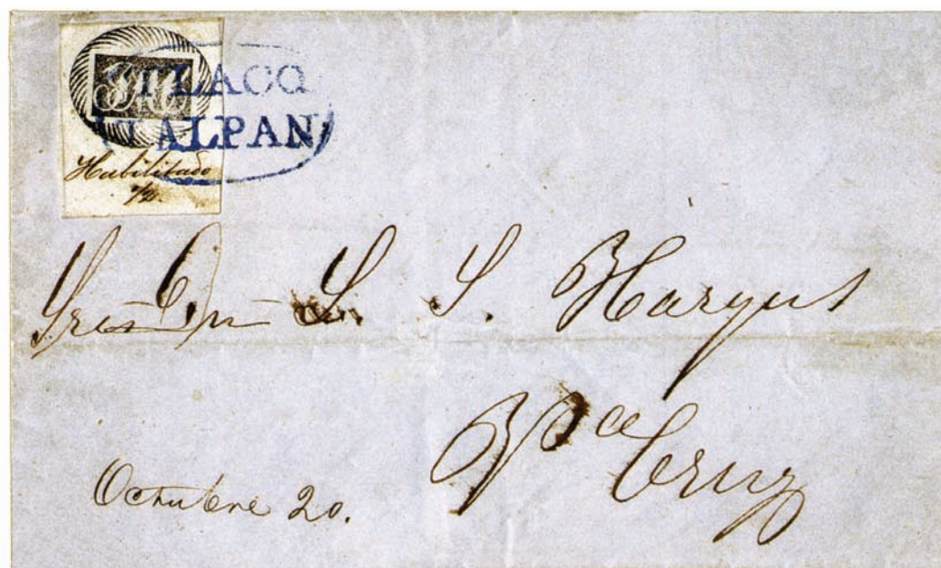
Lettera da Tlacotalpan del 20 ottobre 1856 per Vera Cruz, affrancata con 1/2 real nero, annullato con l'ovale dell'ufficio postale in blu. Vendita da Christie's nel giugno 1992 per 110.000 dollari.