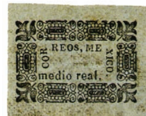
Sopra: il 1/2 real provvisorio di Chiapas. È l'unico noto, di questo valore, non usato.

Altri distretti, infine, giunsero all'emissione di veri e propri francobolli provvisori. In particolare, chi si distinse a questo proposito fu il distretto del Chiapas. Qui vennero emessi, nel 1866, "francobolli" con tutti i soliti tagli (reales 1/2, 1, 2, 4, e 8). Di formato orizzontale erano delimitati da un grosso fregio rettangolare all'interno del quale vi era la seguente dicitura su tre lati: COR/REOS, ME/XICO. In basso, poi, era riportato il valore con la cifra scritta in lettere. Tutti questi esemplari furono stampati su due differenti tipi di carta: bianca o grigia. Si tratta di pezzi decisamente rari, soprattutto su documenti completi. Del mezzo real sono noti solo una ventina di esemplari e pochissime buste. Anche del quattro reales esistono poche buste e in alcune di esse il francobollo è usato frazionato a metà. Dell'esemplare da otto reales, infine, esistono solo tre pezzi in cui il francobollo è intero. Inoltre sono anche note due buste con lo stesso esemplare frazionato a metà e due affrancate con un quarto dello stesso pezzo. Questi "provvisori" vennero adoperati in diversi uffici del distretto. Sono noti: Comotan, Pichuchalco, San Cristobal, Tonalá e Tuxtla.