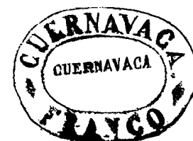
Sopra: il timbro di Cuernavaca molto probabilmente utilizzato per indicare il pagamento di una tariffa da 1 real.

Va anche ricordato che sono conosciute alcune buste in partenza dalla stessa località di Cuernavaca, prive di qualsiasi affrancatura, che riportano un timbro ovale a doppia linea con la dicitura "Cuernavaca/Franco". Ovviamente tutto ciò fa pensare che si tratta di un timbro adoperato prima ancora di emettere il "provvisorio", cioè quando la tassa era riscossa in contanti. Però, l'esistenza di una lettera con tre di tali timbri fa pensare che a ognuno di essi fosse attribuito uno specifico valore. E, quindi, se ciò fosse vero si potrebbe parlare di un altro tipo di "provvisorio".